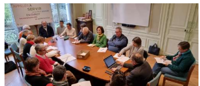
Matinée des services - février 2025

Toutes ces questions vont continuer d'alimenter l'année, en parallèle des travaux qui vont se poursuivre tout au long de l'année 2025.