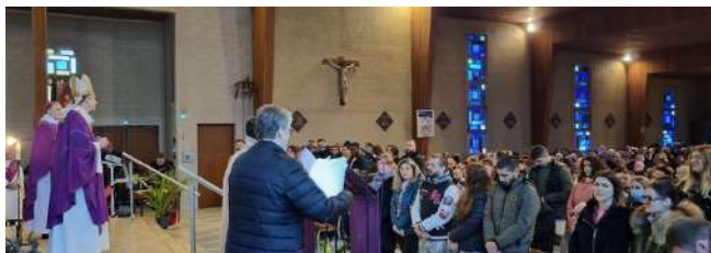
Appel décisif des 72 catéchumènes en 2024

Dans nos espaces missionnaires, de nombreux adultes cheminent vers la vie chrétienne qui commence par les sacrements de l'initiation : baptême, confirmation, eucharistie. Généralement ce parcours dure deux ans. En équipe avec un ou plusieurs accompagnateurs, chacun progresse dans l'expérience de Dieu, dans la connaissance des bases de la foi et dans la découverte de l'Église.