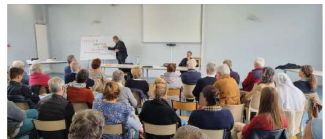
Rentrée des services - septembre 2024

Comment mieux travailler ensemble ? Faut-il regrouper des services en pôles ou travailler en mode projets ? Quel est le sens de la mission de chaque service ? Son appellation est-elle adaptée au monde actuel ?