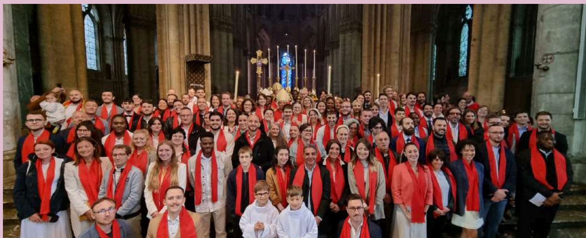
Confirmations des adultes - Dimanche de Pentecôte 2024

* selon le rituel de l'Initiation chrétienne des Adultes