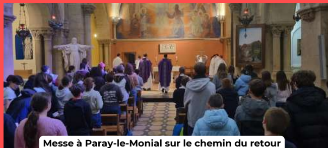
Messe à Paray-le-Monial sur le chemin du retour