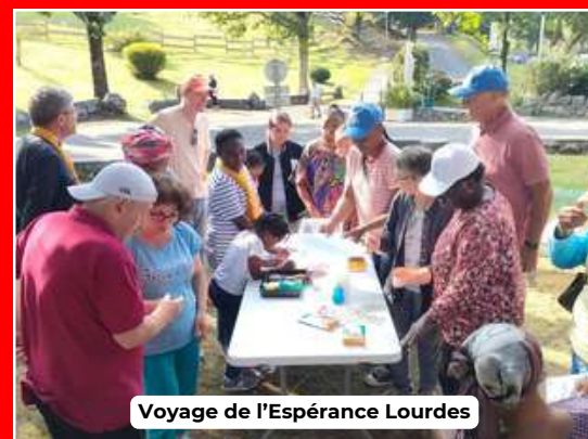
Voyage de l'Espérance Lourdes

Nous vous communiquerons plus tard les différents lieux de rencontre afin de venir célébrer avec nous nos 80 ans d'existence !