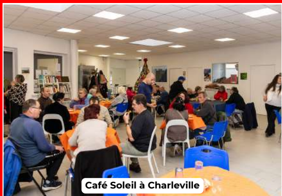
Café Soleil à Charleville

A Reims, nous sommes présents dans plusieurs quartiers, notamment à Châtillons, Europe et Croix-Rouge où les bénévoles rencontrent les habitants afin d'étudier leurs besoins. Notre accueil de jour dans le centre-ville propose aux personnes en précarité des petits-déjeuners, des douches, un espace pour déposer leurs bagages ou tout simplement rencontrer d'autres personnes.