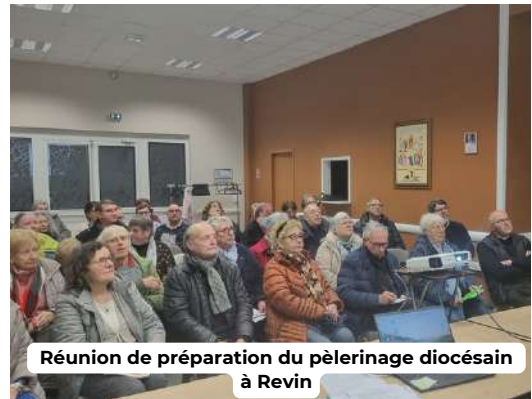
Réunion de préparation du pèlerinage diocésain à Revin