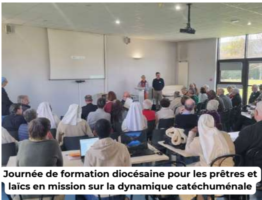
Journée de formation diocésaine pour les prêtres et laïcs en mission sur la dynamique catéchuménale