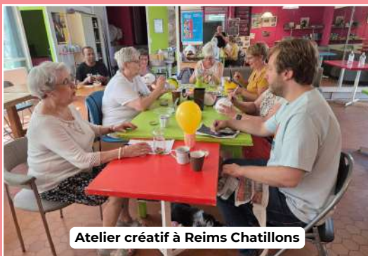
Atelier créatif à Reims Châtillons

L'action du Secours Catholique-Caritas France s'est toujours ancrée dans l'actualité.