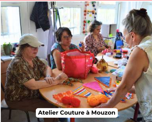
Atelier Couture à Mouzon

Je m'occupe principalement de l'accueil et de l'accompagnement des personnes. Je les reçois, je les écoute et je suis leurs dossiers en lien avec les assistantes sociales. C'est ce que je fais depuis mon arrivée à Reims.