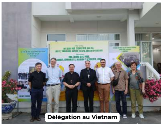
Délégation au Vietnam