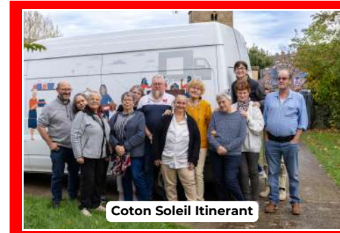
Coton Soleil Itinerant

Ce qui me touche le plus, ce sont les situations où il y a des enfants. J'y suis particulièrement sensible. Je me souviens aussi d'une personne très malade que j'ai reçue. Elle ne pouvait presque plus se déplacer. Sa fille était venue me voir pour me demander si je pouvais aller à son domicile. Finalement, ce monsieur est venu deux fois à l'accueil. Nous avons tous les deux un paquet de mouchoirs à côté de nous, car il me racontait sa vie. Avant de partir, il m'a remerciée de l'avoir écouté et d'aider les gens. Il m'a confié qu'il avait passé beaucoup de temps en prison, mais cela ne m'a jamais dérangée. Pour moi, l'important est d'aider chacun sans jugement.