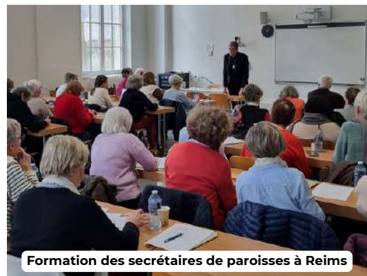
Formation des secrétaires de paroisses à Reims