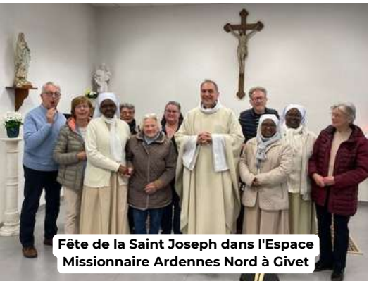
Fête de la Saint Joseph dans l'Espace Missionnaire Ardennes Nord à Givet