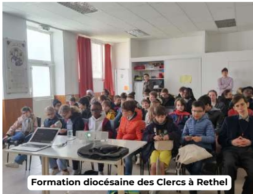
Formation diocésaine des Clercs à Reims