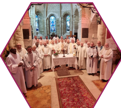
Journée du Presbytérium