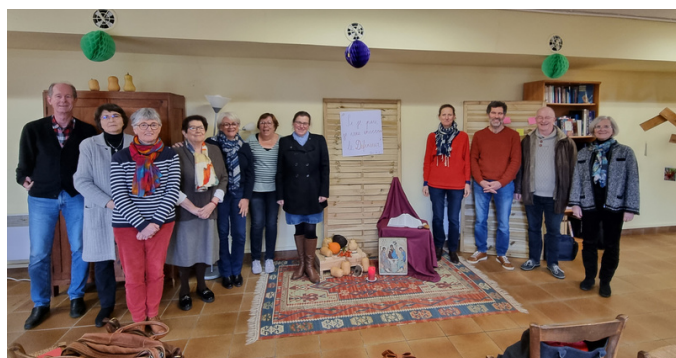
Rencontre des services diocésains sur la diaconie à St Joseph à Reims

Enfin le dernier temps de la formation, vécu en espace missionnaire, sera un temps de relecture et de décision pour une mise œuvre concrète dans les différentes réalités du diocèse.