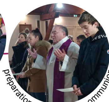
préparation à la première communion