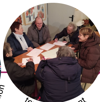
temps de l'Avent