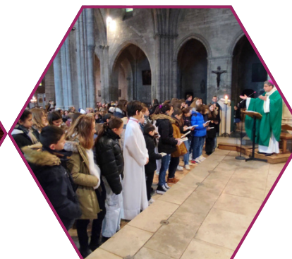
Étape du chemin vers la confirmation