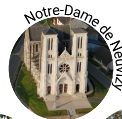
Notre-Dame de Neuvizy