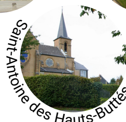
Saint-Antoine des Hauts-Buttés